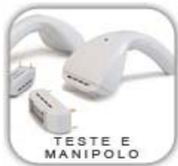
TESTE E MANIPOLO